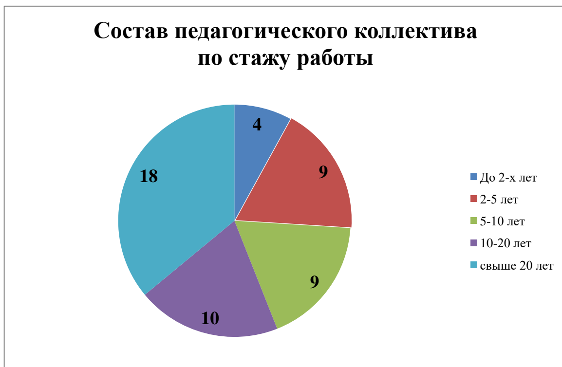
Рисунок 1 – Состав педагогического коллектива «ДЮСШ» Кольского района по стажу работы