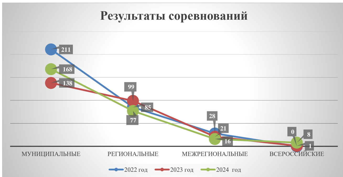
Рисунок 3 – Результаты соревнований занимающихся «ДЮСШ» Кольского района с 2022 по 2024 года

Результаты соревнований занимающихся «ДЮСШ» Кольского района с 2022 по 2024 года приведены на рисунке 3.